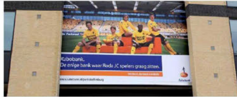
Het stadion van Roda JC - dat nog wel samenwerkt met de Rabobank.

De Rabobank wil niet langer clubs in het betaalde voetbal als klant. Ook moeten bankmedewerkers met nevenfuncties in de voetballerij op termijn afstand doen van hun taken.