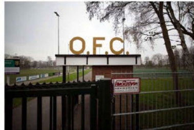
De grote financier van OFC wordt in verband gebracht met zeven gevallen van intimidatie en bedreiging.

Zelden wijst onderzoek precies uit waarom ondernemingen zijn beschoten of doelwit waren van een explosief. Soms heeft de recherche geen idee en kunnen de getroffen personen het evenmin duiden. Lang blijft dat zo als granaten zijn achtergelaten voor het beroemde Vlaams Friteshuis Vleminckx in de Voetboogstraat in de Amsterdamse binnenstad, bij Sportmedisch Centrum Eyslomed achter het Olympisch Stadion en op de Haarlemse Botermarkt.