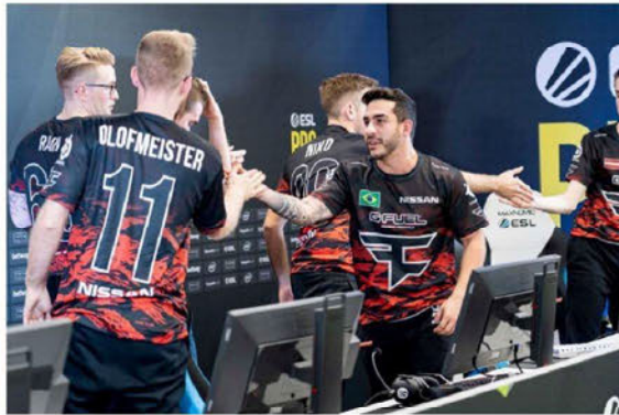
FaZe Clan's CS:GO team consists of absolute top players.

The website was shut down after a couple of months, after they made enough cash to buy the CS:GO team. The estimated costs were around $1 million - a profitable investment as Banks suspected a larger price tag in the near future: "We got to figure out how make enough money to buy this team now." According to him, many organizations make money with this method to this day.